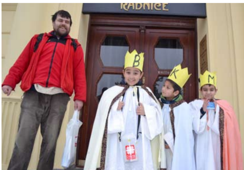
KOLEDNÍCI. Aktéři Tříkrálové sbírky před slezskoostravskou radnicí.