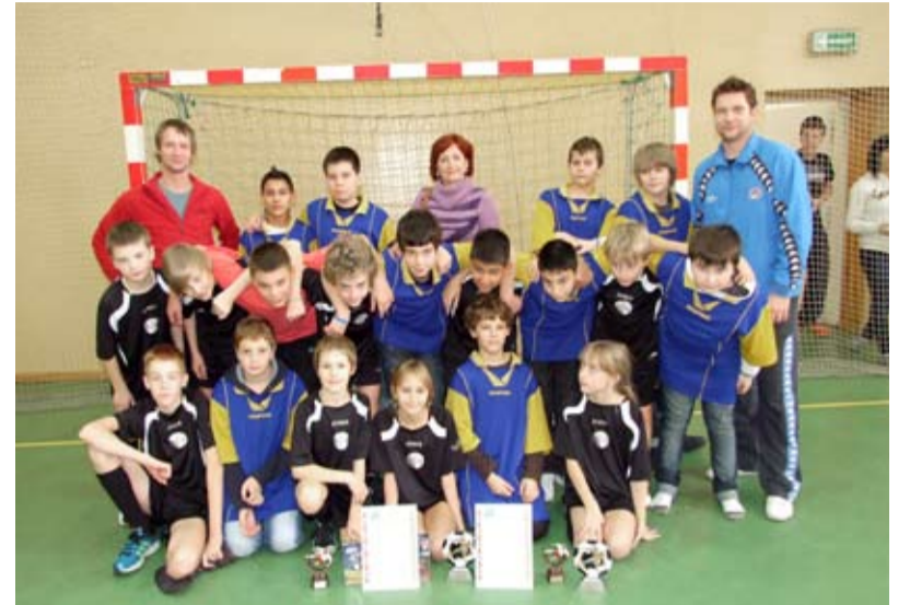
HALOVÁ KOPANÁ. Žáci ZŠ Chrustova vybojovali v Polsku dva poháry a diplom.