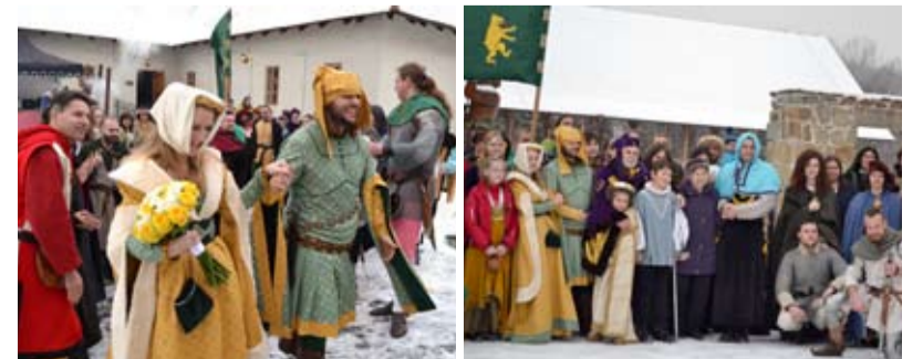
DOBOVÁ SVATBA. Netypická svatba se konala na Slezskoostravském hradě. Svatebčané se inspirovali ve středověku.