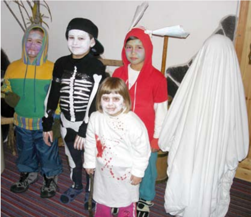
ZÁBAVA V BESKYDECH. Děti z dětského domova se baví na horské chatě Třešník.

Nastal čas, kdy jsme my, děti z dětského domova, mohly odjet na hory, a to chatu Třešník v Beskydech. Milé přijetí zaměstnanců chaty a nádherné zimní počasí, to byl začátek našeho vánočního pobytu. Zdravý vzduch na horách, to je účelem pobytu, který v Ostravě v zimním období nemáme. Uvnitř výborné jídlo a venku sníh, sjezdovka přímo u chaty a pro nás možnost jezdit na saních a bobech. Při této aktivitě a celém pobytu na nás dohlížely studentky a zdravotnice, které nám připravily zajímavou celotáborovou hru a soutěže v zimních sportech. Tak ubíhaly dny až do Štědrého dne, kdy nám bylo připraveno vše,