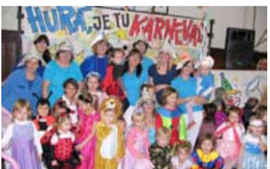
KARNEVAL. Pohádkové bytosti se v hojném počtu dostavily do Koblova.

Mnoho pohádkových bytostí jako vodníci, princezny a rytíři tancovalo a soutěžilo 4. ledna na tradičním karnevalu, který každý rok pořádá MŠ Koblov. Na začátku zatančily všechny děti společně se svými učitelkami taneček a o další prima zábavu se postaral klaun Hopsalín. Atmosféra byla výborná a už se všichni těšíme na příští karneval.